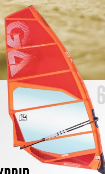
6 SPÍR 6.7; 7.2; 7.7; 8.2 FREERIDE