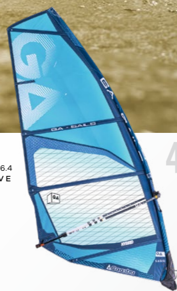
4 SPÍRY 3.7; 4.2; 4.7 POWER WAVE